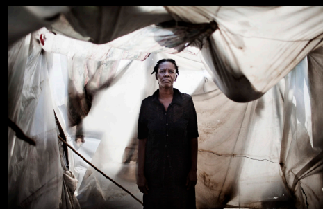
Lauréat 2011