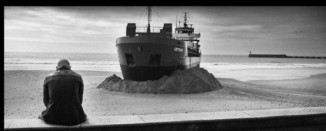
Lauréat 2009

Un livre montrant les 15 photos primées et les photos finalistes de chaque catégorie sera édité avec un portfolio sur le photographe d'honneur.