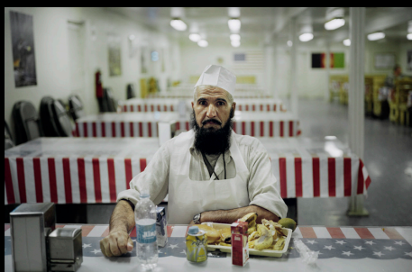
Lauréat 2010